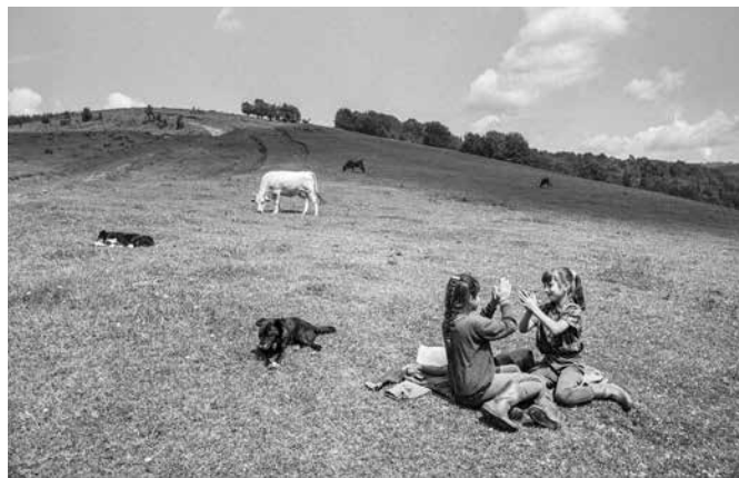
Z Polonin.

Území Podkarpatské Rusi bylo zpočátku spojeno se zednářským hnutím nepřímě. Dlouho před vznikem místních zednářských organizací emigrovali rusínští učenci z Uherského království do zahraničí za prestižní práci. Zejména v 18. a začátkem 19. století se pro ně stalo oblíbenou „destinací“ carské Rusko. Oproti Uhersku to bylo pole neorané.