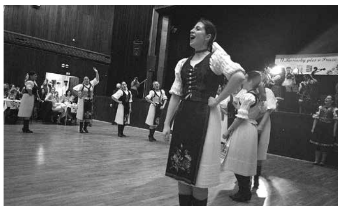
Z plesového reje spolku Rusíni.cz

spolku museli pár let počkat. Ale poté, co hosty u vstupu přivítaly krojované dívky, se najednou oněch pět let, které uplynuly od posledního plesu, náhle zdálo jenom jako mrknutí oka. Před plesem se sál postupně zaplňoval slavnostně oblečenými hosty; někteří byli ve společenském, jiní v krojích, což podtrhovalo folklórní charakter celého večera. Každý si našel svou skupinu, usadil se a mohlo to začít.