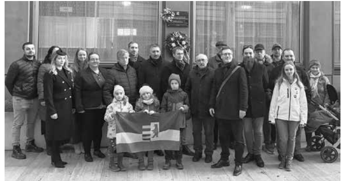
Русины при памятной таблі кодифікації на інтернатах Дружба в Братіславі.