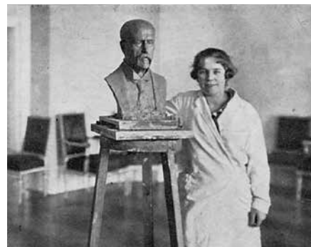
Sochařka s bustou TGM