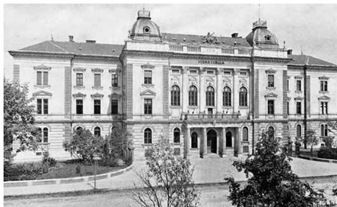
Sídlo Soudní tabule v Košicích, resp. po reformě soudnictví Vrchního soudu v Košicích. Deset let Československé republiky. Díl I. Praha 1928, s. 483.