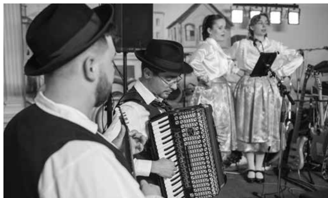
Z Juliánského plesu