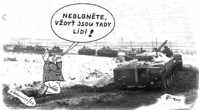
kresba Fedor Vico

* V Medzilaborcích v létě otevřou po dvou letech zrekonstruované Muzeum moderního umění nesoucí Warholovo jméno . „Komplexní rekonstrukce muzea, které nese ve svém názvu jméno světového umělce, a je paradoxně jediné v Evropě, přináší možnosti pro výrazné změny zejména v oblasti cestovního ruchu. Primárně je to šance pomoci lokální ekonomice a efektivněji připoutat návštěvníky nejen k muzeu a Medzilaborcům, ale také k regionu a jeho dalším krásám,“ říká ředitel muzea Martin Cubjak.