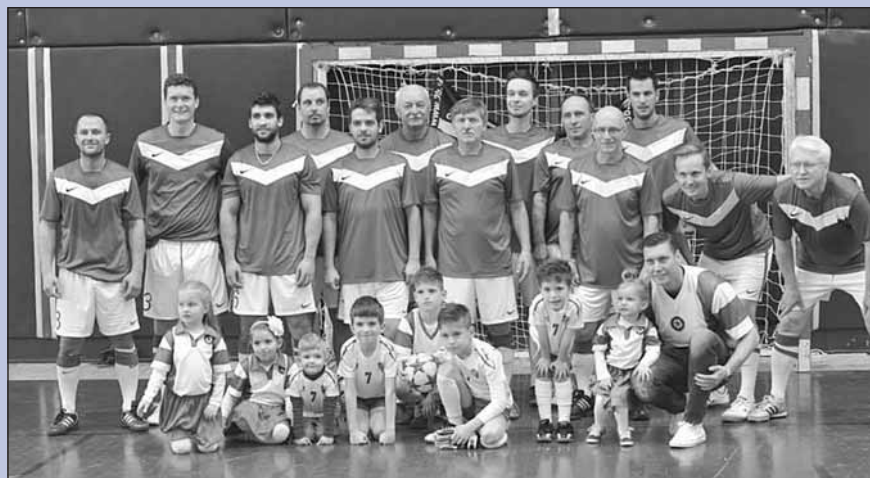
V súčasnosti nastupuje PAVLOVIC TEAM na exhibície už aj s najmladšou generáciou