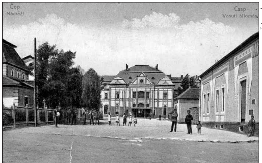
Budova hlavního nádraží. Byla zničena během 2. světové války v r. 1944