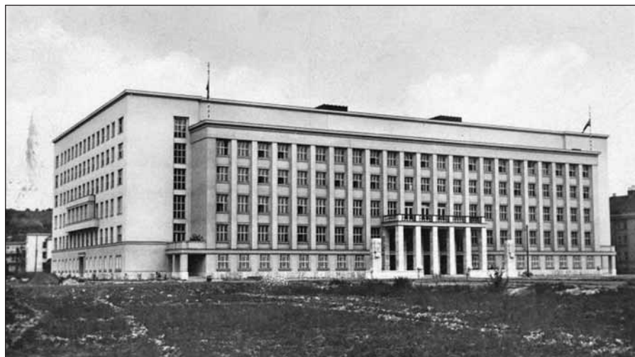
Bývalý zemský úrad, nyní sídlo oblastní rady v Užhorodě

Optáciu Rusínov predchádzalo násilné vysídľovanie poľských Rusínov – Lemkov