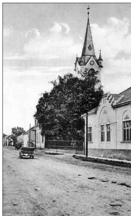
Evangelický kostel na hlavní ulici