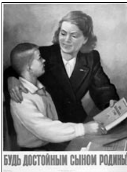
Dobový sovětský propagandistický plakát

Školství se konsolidovalo začátkem 50. let s příchodem nové generace učitelů, většinou už místního původu. Avšak místo na školách se pro ně našlo pouze na vesnici, v městských školách byl učitelský sbor výhradně východního původu. Koncem 50. lét nastala další pohroma: „Reformátor“ Nikita Chruščov vyhlásil program budování komunismu, jehož budovatelé museli mít středoškolské vzdělání. Horliví úředníci narychlo zakládali v každém městečku a větší vesnici desetiletky (před-