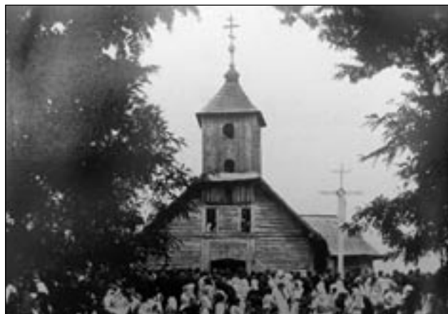
Filiálna pravoslávna cerkev v Bilkách

do konfliktu týchto dvoch cirkví. To potom tzv. Veľkorusi využívali štváním obyvateľstva proti vláde a republike, ktorej vyhlásili najostrejší boj. Zároveň v tomto náboženskom boji videli aj politické pozadie, pretože si podľa neho chceli tzv. Veľkorusi pripraviť pôdu pre nastávajúce voľby. V podobnom duchu nám Slovenský východ podáva obraz o situácii na Podkarpatskej Rusi aj o mesiac neskôr, kedy už pravoslávne hnutie šírené stúpcami veľkoruského smeru nadobudlo obrovské rozmery zachvacujúc jeden okres za druhým. Pravoslávne hnutie sa rozširovalo z Izy do Chustu a Tjačeva (Tlačiv), ako aj do Iršavy, Dolhy, Berehova a mnohých obcí v Marmarošskej župe. Pravoslávny boli vytykané násilné excesy v množstve lokálnych konfliktov, čoho dôsledkom mali byť žiadosti gréckokatolíckych veriacich o povolenie ozbrojiť sa a „hájiť sa tak proti násilníckemu postupu pravoslávnych, ako aj použitie vládneho vojska na nastolenie poriadku. Následkom týchto opatrení podľa denníka pravoslávni štvli obyvateľstvo proti Čechom, čím údajne dokazovali, že náboženská otázka je len „plášťikom, za ktorým sa skrývajú ich politické a povieme priamo boľševické snahy.“