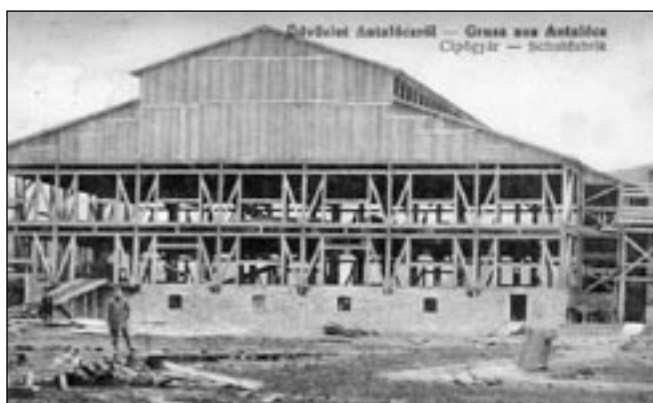
Vojenský drevársky podnik - hala na výrobu dreva

V r. 1914-1916 bol v Antalovciach vybudovaný rozsiahly drevársky podnik, ktorý patril pod rakúsko-uhorské ministerstvo obrany vo Viedni. V období 1. svetovej vojny sa tu nachádzal veľký zajatecký tábor. Zajatci, prevažne Rusi a Taliani, vyrábali pražce, dyhy, sudy i dreváky. Je zrejmé, že pobyt vo vojenskom lágri v podmienkach ťažkej práce, zlej stravy a nedostatocnej lekárskej starostlivosti prinášal málo radosti. Mnohých zajatcov udržiavala pri živote nádej na návrat do vlasti, iní podľahli útrapám. Na miestnom vojenskom cintoríne odpočívajú svoj večný sen 118 ruských zajatcov. Za zmienku stojí skutočnosť, že vojenská správa tábora vydávala pre zajatcov núdzové peniaze tzv. Kassa schein v hodnote 50 hal., 1K, 2K a 10K, ktoré sú dnes vzácné a hľadané medzi zberateľmi.