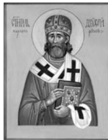
Ikona – sv. biskup vyznávač Dositej (Vasić) Karpatoruský a Záhrebský