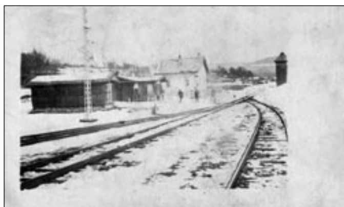
Železničné nádražie v Antalovciach